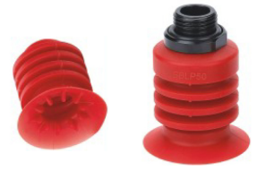
最适合用于吸附形状不规则的包装物品、冷冻食品袋、水袋等

GBLP - 30 - S - 02M - T1 ①吸盘盘径 ● ②吸盘材质 ● ③安装方式 ● ④塞头 ●